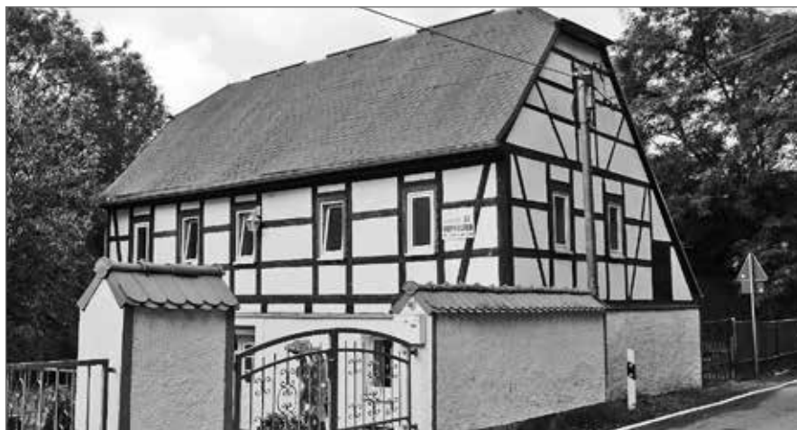
Fachwerkhäuser wie dieses prägen das Ortsbild vieler ländlicher Gemeinden im Landkreis Mittelsachsen. Sie stecken oft voller Charme und Geschichte. Die Veranstaltungsreihe „ländliches Bauen“ möchte das Interesse an regionaler Baukultur stärken, indem sie eine Plattform zwischen Bauinteressenten, Unternehmen und Fachleuten bietet. Im Herbst findet die dreiteilige Reihe zum zweiten Mal in Mittelsachsen statt.

Weitere Termine werden in Kürze unter www.nestbau-mittelsachsen.de bekannt gegeben.