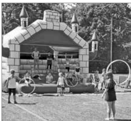
Austoben zwischen den Trainingseinheiten

Am ersten Ferienwochenende trafen wir uns wie jedes Jahr in unserer Turnhalle zum alljährlichen Trainingslager. Auch Petrus meinte es gut mit uns und schenkte uns nach einem sehr stürmischen und gewittrigen Donnerstag drei Tage voller Sonne.