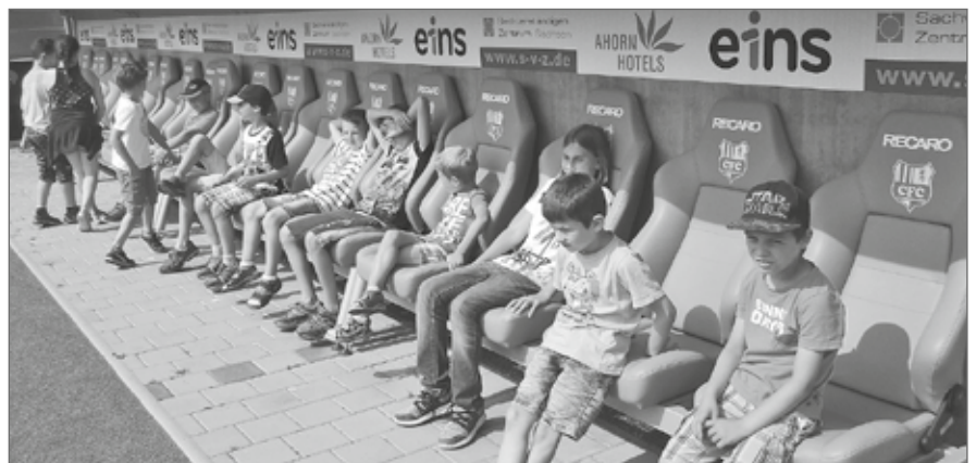
Stadiontour in der Community4you-Arena in Chemnitz