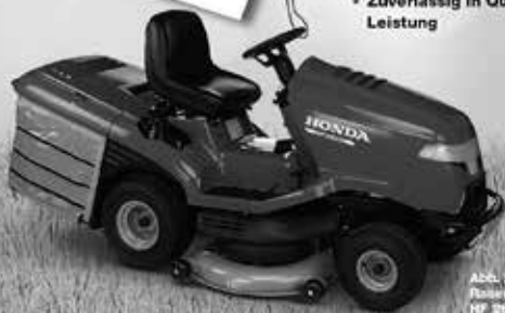
Abbl. zeigt Baumstumpfschneidwerk HF 3022 HT

© Ausstattungsvarianten und Motorleistung Körperfarbe, Zubehör und weitere Details sind ohne Gewähr.